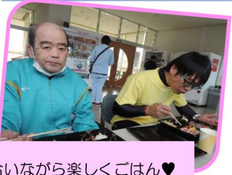
お昼のお弁当(♡)/ 皆で頑張りをたたえ合いながら楽しくごはん♡