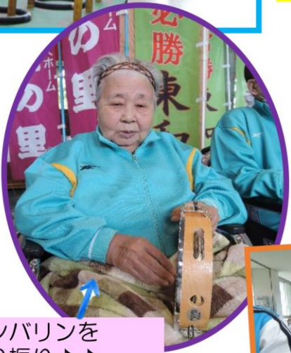
タンバリンを振り振り♪♪ フレーフレー アイリスチーム♪